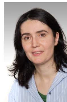
Julia Kisch Bildungs-Organisation, Peer-Beratung